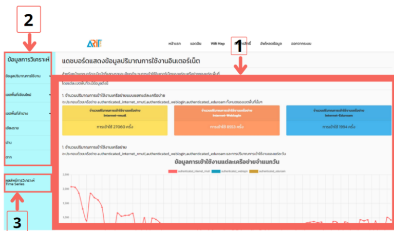
ภาพที่ ก.5 หน้าแสดงข้อมูลปริมาณการใช้อินเทอร์เน็ต