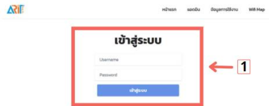
ภาพที่ ก.4 แสดงส่วนเข้าสู่ระบบ

หมายเลขที่ 1 ผู้ดูแลกรอก Username Password เพื่อเข้าสู่ระบบ