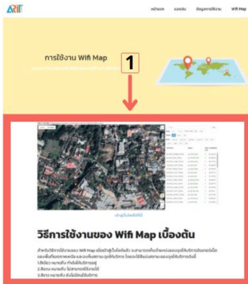
ภาพที่ ก.3 หน้าแสดงวิธีการเข้าใช้งาน Wifi Map เบื้องต้น

หมายเลขที่ 1 ส่วนของคำอธิบายวิธีการใช้งานของ Wifi Map